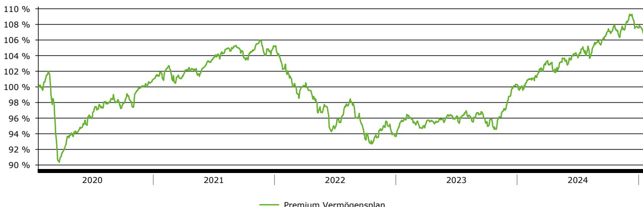
— Premium Vermögensplan